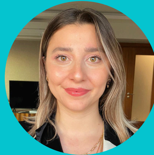
DAMLA SERÇE UNAT OLGU SUNUMU